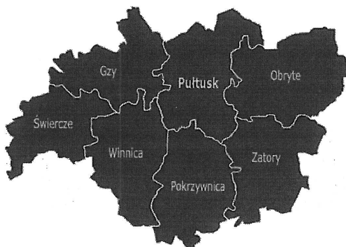
Rysunek 2. Gmina Świercze na tle powiatu pułtuskiego.

Obszar jest zamieszkiwany przez 4712 osób (stan na 31.12. 2014 r.). Gmina swoim zasięgiem obejmuje 28 sołectw. Graniczy z 5 gminami tj.: Gzy, Nasielsk, Nowe Miasto, Sońsk, Winnica.