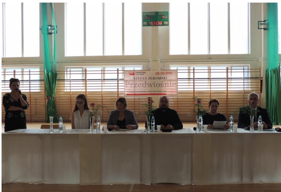
Narodowe Czytanie „Przedwiośnia” Stefana Żeromskiego

W wydarzeniach tych wzięło udział 833 mieszkańców. Biblioteka poniosła w związku z tymi wydarzeniami wydatki w kwocie 2 550 zł.