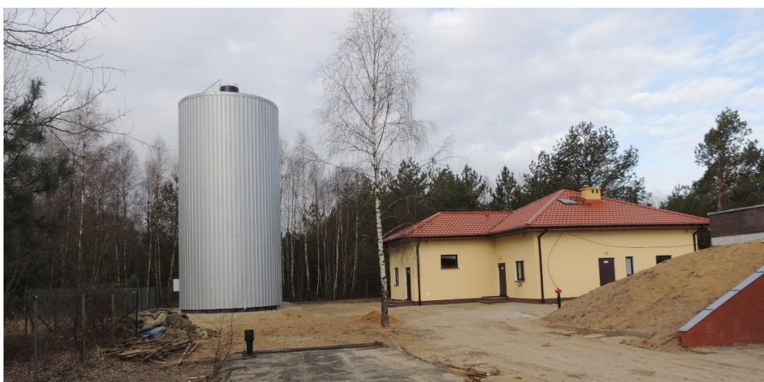
Stacja uzdatniania wody w Klukówku

Długość czynnej sieci wodociągowej na początek 2018 r. wynosiła 155,84 km, a na koniec 157,15 km, liczba przyłączy 1179. Sieć wodociągową oraz stacje uzdatniania wody w Świerczach i Klukówku obsługuje Zakład Usług Wodnych w Mławie. W przypadku sieci kanalizacyjnej dane przedstawiają się następująco: 7,99 km na koniec roku i 195 przyłączy. Obsługę mieszkańców w zakresie zbiorowego odprowadzania ścieków prowadzi Gmina. Zakładowi Usług Wodnych w Mławie powierzone zostało administrowanie (techniczna obsługa) oczyszczalni i sieci kanalizacji.