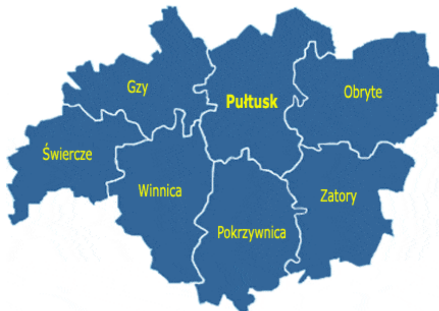
Rysunek 2. Gmina Świercze na tle powiatu pułtuskiego